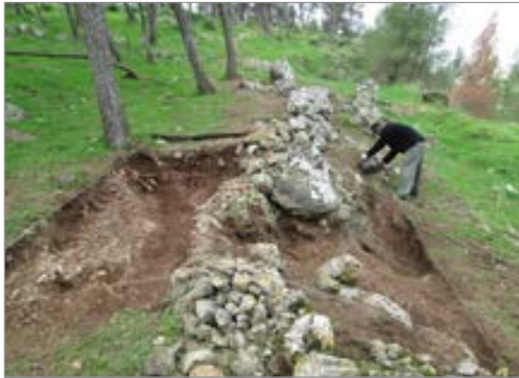
איור 4. ריבוע A, חתך בשביל F10, מבט למערב.

כניסה של מקנה, מניעת סחף ושימור קרקע, ומקום לסיקול.