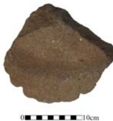
איור 11. שבר קערת בזלת מ-F21, ריבוע G.

קברי ארגז F23: נוקו 3 קברי ארגז חצובים במעלה הגדה המערבית. חלקם המערבי של שני הקברים התחתונים נפגע על ידי המחצבה הישנה. שני הקברים התחתונים מקבילים וצמודים זה לזה, בכיוון צפון-מערב - דרום-מזרח, והשלישי מעט גבוה מהם וניצב אליהם. הקברים עוצבו כארגז. סביב ראש הדופן של הקבר התחתון ניכר עיצוב מגרעת שנועדה לייצב את המכסה (שלא שרד). רוחב הדפנות 15-20 ס"מ. קברים רבים מסוג זה נמצאים בסביבות נוריס, וכן סביב לתל יזרעאל.