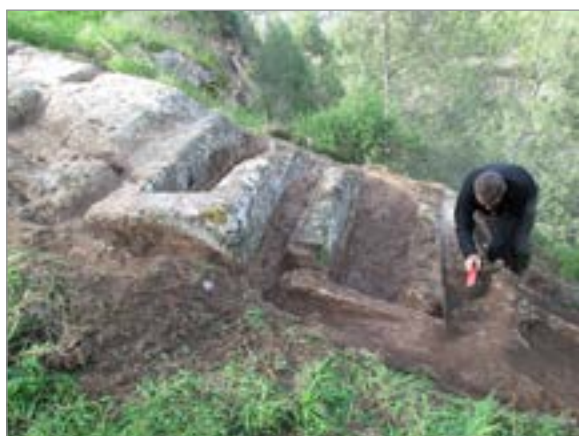
איור 12. קברי ארגז F23, מבט לצפון.