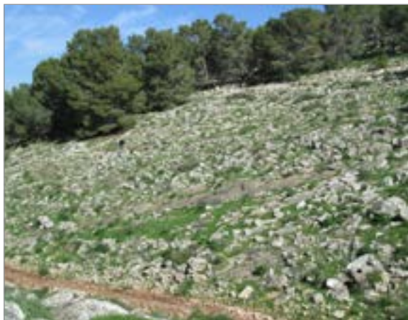
איור 2. הגדה המזרחית, מראה כללי. הדמות ניצבת על שביל.