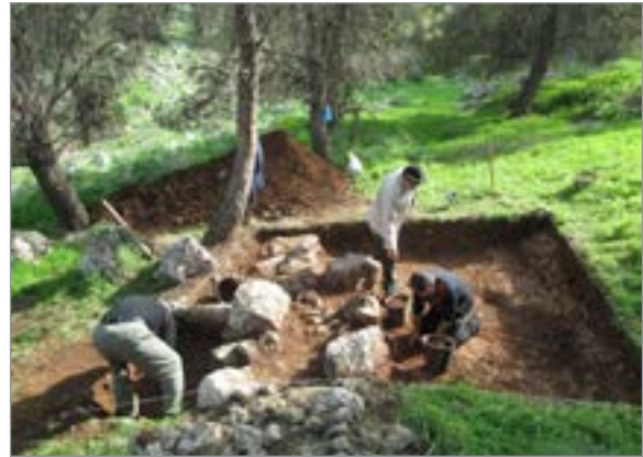
איור 5. ריבוע B, שביל F11 ופינת קו תיחום F22, מבט לדרום.