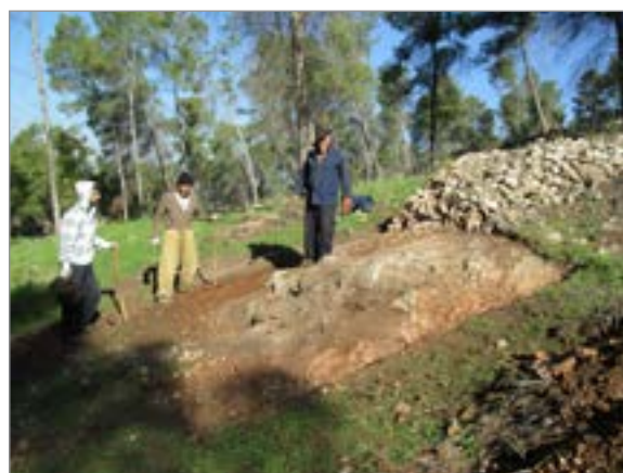
איור 10. ריבוע F, חתך בערמת סיקול F19, מבט לצפון-מזרח.

קערת שחיקה מבזלת, שנזרקה לערמה לאחר שנשברה (איור 11).