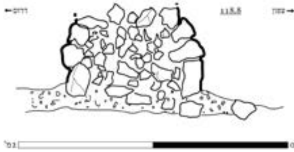
איור 6. חתך אופייני בטרסה, F14, ריבוע E.