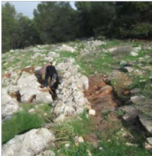
איור 8. ריבוע D, שביל F13, מבט לצפון.