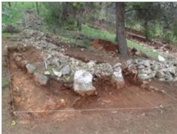
איור 7. ריבוע E, פינת טרסה F14, מבט לדרום-מזרח.