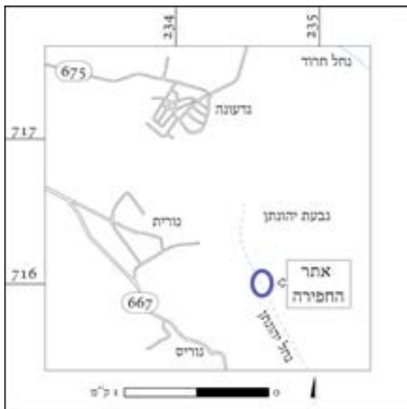
איור 1. מפת איתור.

החפירה נערכה מטעם חברת י.ג. ארכיאולוגיה חוזית בע"מ ובחסות המכון למקרא ולעתיקות על שם נלסון גליק (נוריס B-398/2013), נוהלה על ידי א' כהן-תבור בסיוע י' גוברין (מנהלה).