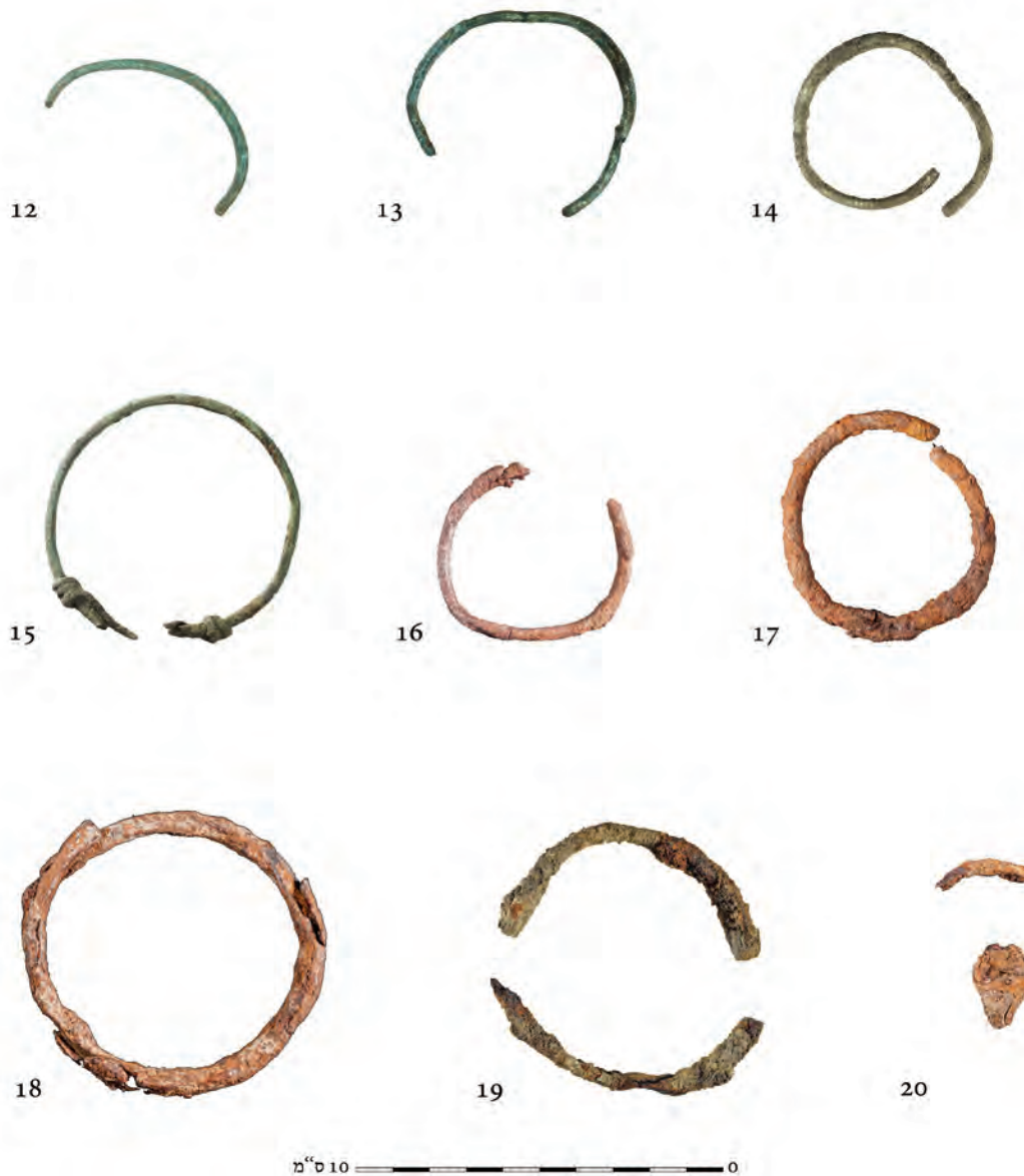
איור 11. חפצי המתכת מקברים I-II.

מחלוקי נחל קטנים או משברי צדפים, אבני גיר וגושי כורכר (הוסטר ושיאון תשס"ו:50). מפולת כזו נמצאה במילויים בשני הקברים. רוב הקברים מטיפוס זה כוללים חדר יחיד עם חלוקה פנימית לשקתות או לתאים. קברים בעלי תוכנית דומה לזו שנתגלתה בחפירתנו, קרי שני חדרים עם דופן משותפת, מוכרים בחורבת בריכה (למדן ואחרים תשל"ח:183) ובאל-ג'ורה שבאשקלון (קוגן-זהבי 2010). 5 בשני אתרים אלה תוארכו הקברים לתקופה הביזנטית. לדעת הוסטר ושיאון,