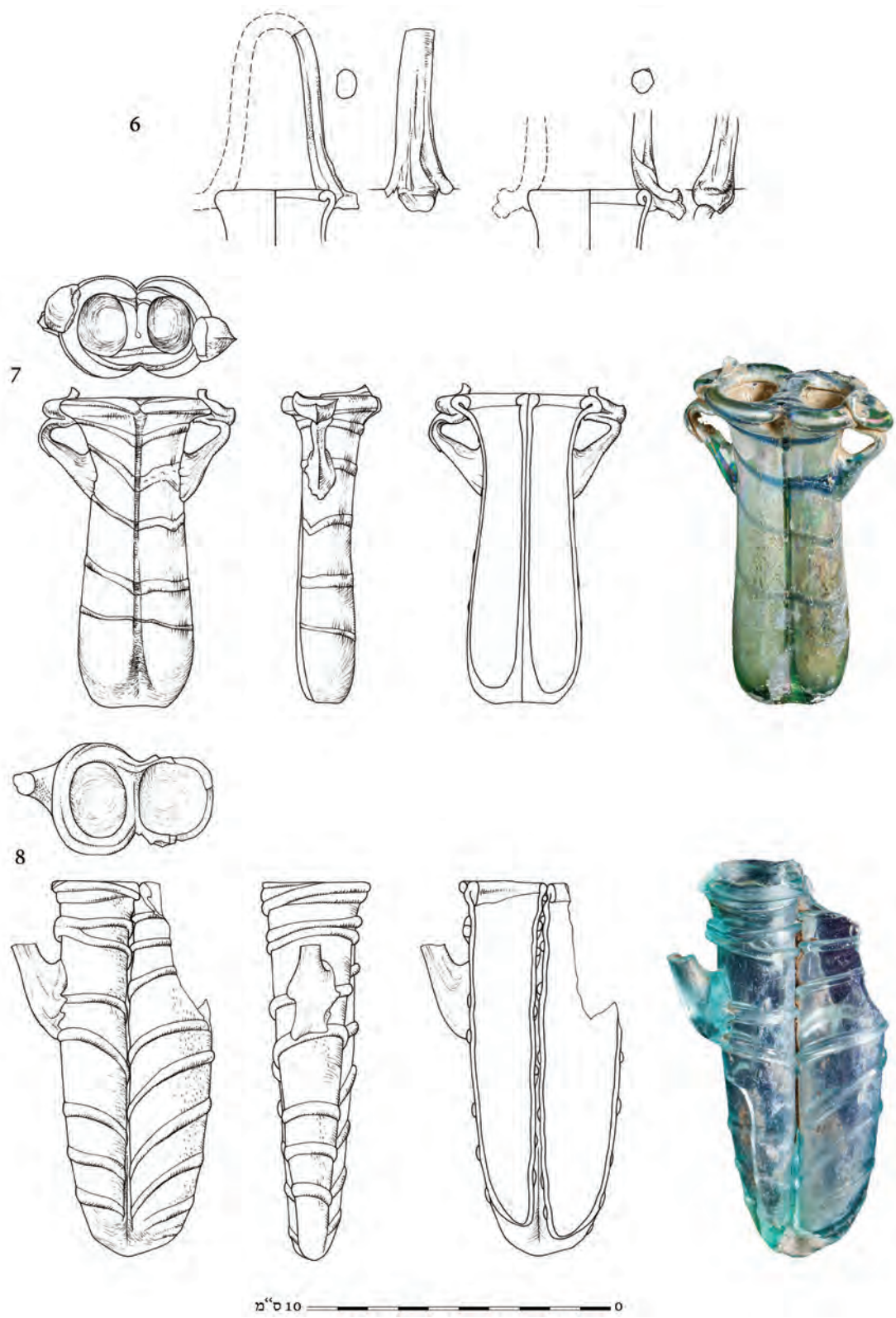
איור 9. כלי הזכוכית מקברים I ו-II.